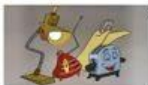
Doña Tostadora celebrando su hazaña.

Para que las noticias sean completas deben responder a las siguientes preguntas: